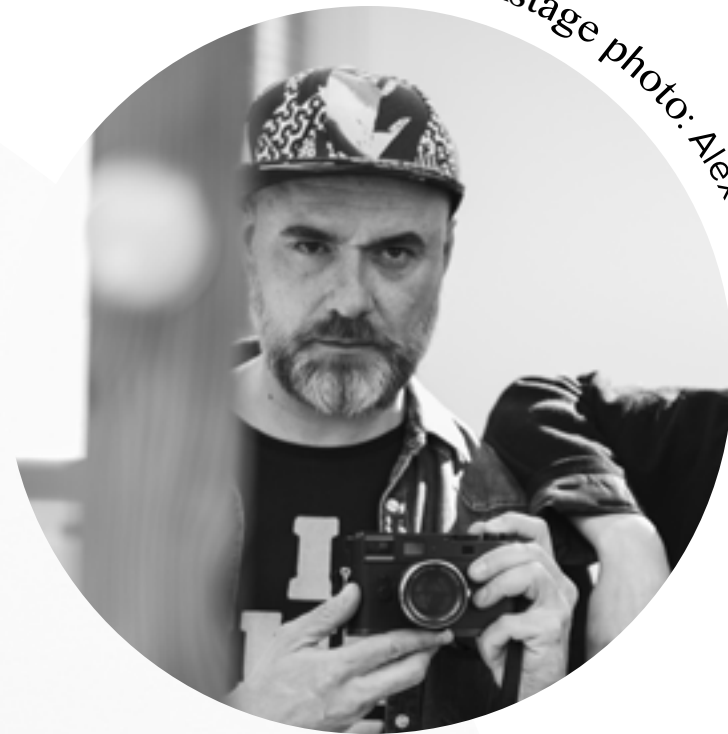
Backstage photo: Alex Czyba