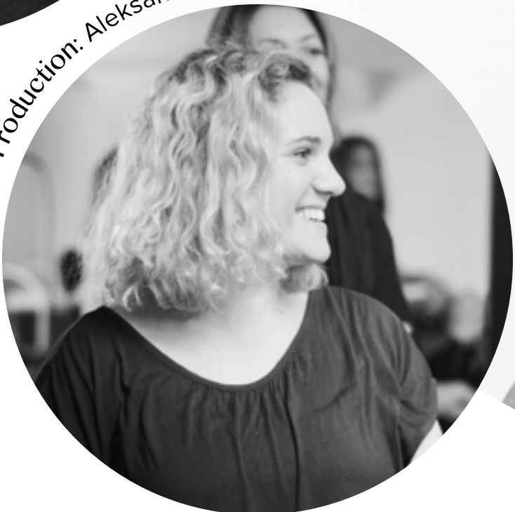
Executive Production: Aleksandra Dyras